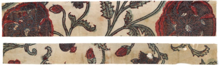
▲大唐花手銀更紗(一字字裂)