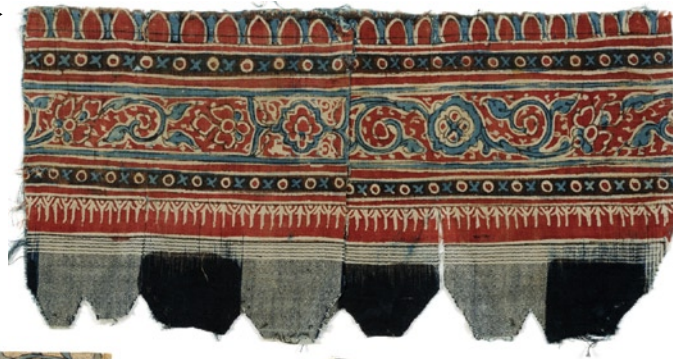
緋石畳文更紗 (茶碗解袋)