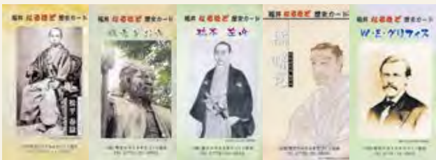
福井なるほど歴史カード