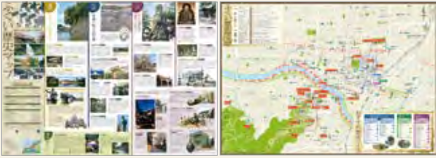
ふくい歴史マップ