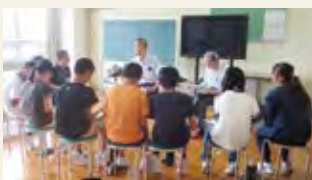
グループに分かれての学習の様子

児童の皆さんは、自身の将来の目標や我が国の在り 方など、左内先生と同じように将来を見据えて希望を 抱いていました。