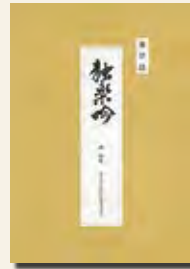
全訳註 独楽吟 (410円)