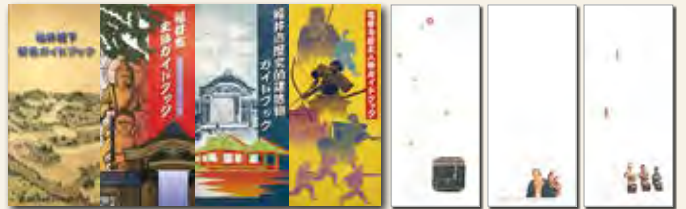
福井市歴史ガイドブック (各210円)