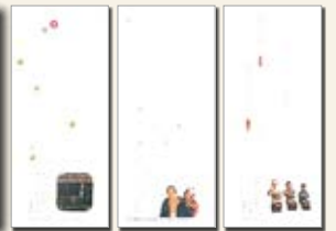
独楽吟人形一筆箋 (310円)