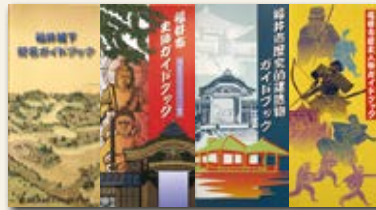
福井市歴史ガイドブック (各210円)