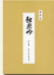
全訳註 独楽吟 (410円)