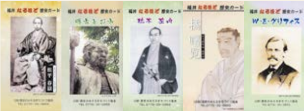
福井なるほど歴史カード