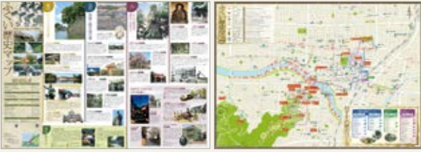
ふくい歴史マップ

ご希望の方に無料で配布しています。 どうぞご利用ください（ただし、数に限りがございます）。