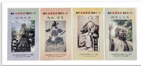
継体天皇 結城秀康 松平春嶽 勝家とお市