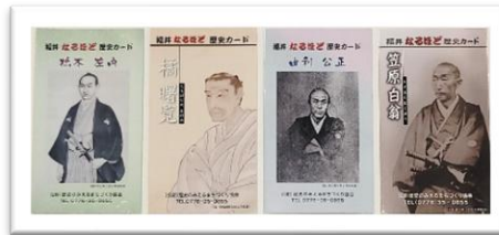
橋本左内 橘曙覧 由利公正 笠原白翁