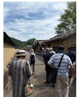
朝倉氏遺跡現地での研修

今年度も昨年に引き続き、グループ勉強会を行います。昨年からのテーマを引き続き勉強したり、現地研修や新規テーマもあります。